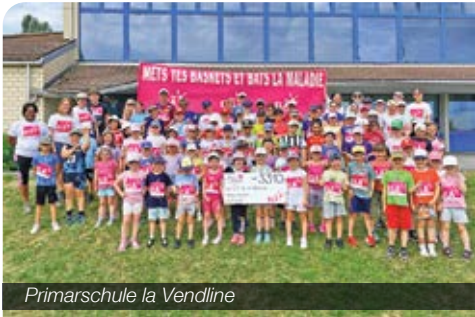
Primarschule la Vendline

Im Jahr 2025 haben über 1400 Schülerinnen und Schüler an der Aktion «Lauf los für ELA und besiege die Krankheit» teilgenommen und CHF 42'206.- zur Unterstützung der sozialen Ziele von ELA Schweiz gesammelt. Ein grosses Dankeschön gilt allen und Schulleitungen für ihre Tatkraft und ihr Engagement.