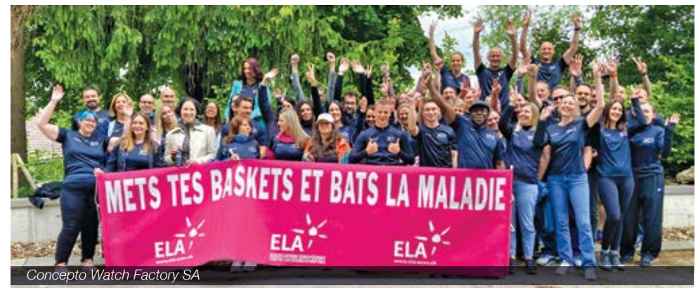
Concepto Watch Factory SA