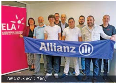
Allianz Suisse (Biel)