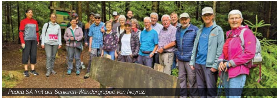
Padea SA (mit der Senioren-Wandergruppe von Neyruz)