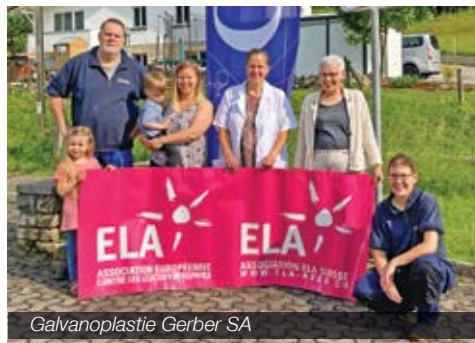
Galvanoplastie Gerber SA