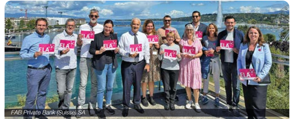
FAB Private Bank (Suisse) SA