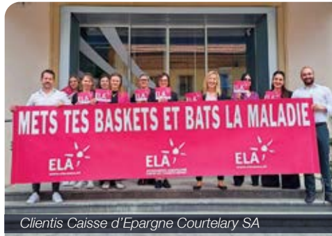
Clientis Caisse d'Epargne Courtelary SA

Am 6. Juni 2025 haben sich über dreissig Unternehmen an der Kampagne «Lauf los für ELA im Unternehmen» beteiligt. Im Rahmen dieser Solidaritätsaktion konnten CHF 33'530.- für den Kampf gegen Leukodystrophien gesammelt werden. Ein herzlicher Dank gilt allen beteiligten Unternehmen für ihre wertvolle Unterstützung.