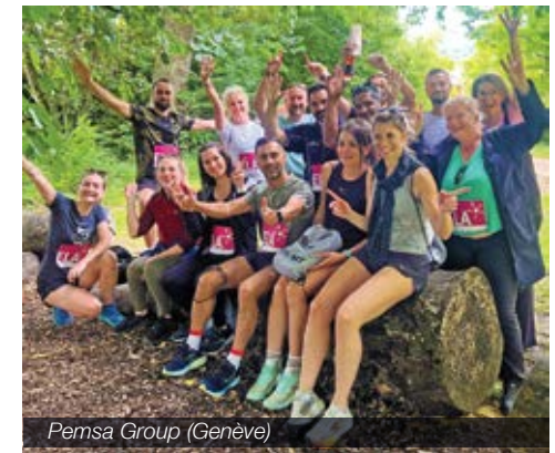
Pemsas Group (Genève)