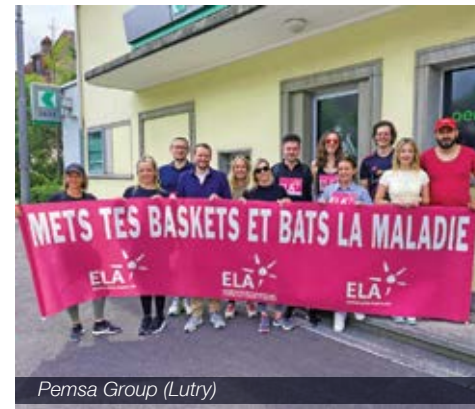
Pemsas Group (Lutry)